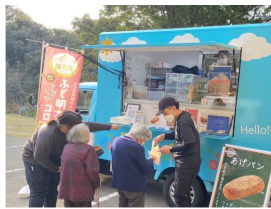
社会福祉法人サンシャイン会 駐車場内での販売の様子