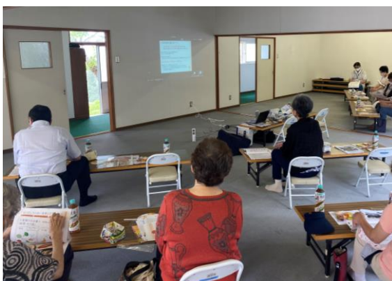
2020年8月北海道室蘭市で開催したリモート栄養講座

などの活動を通じ、「低栄養」「サルコペニア」「フレイル」予防に役立つ知識と対策を広く知ってもらうことで、毎日の食事の重要性を再認識してもらった結果と分析しています。また、利用者向けには会報誌「あはは」にて毎号、1万件以上の栄養相談経験をもとに管理栄養士が、正しい知識とすぐに実績できるアドバイスを載せています。